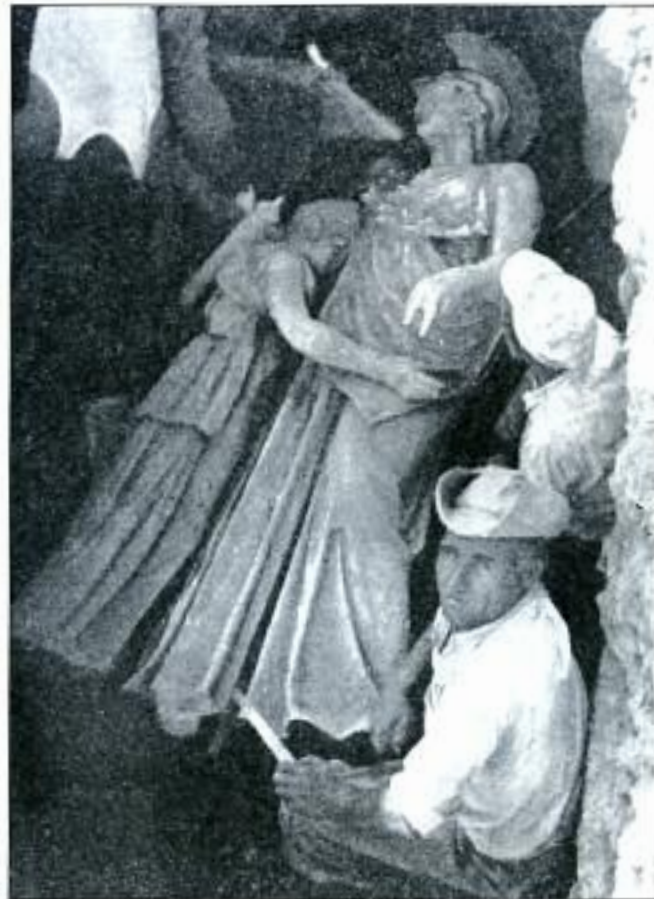
Μία σπάνια φωτογραφία από την αποκάλυψη των χαλκίνων αγαλμάτων (Αθηνάς - Αρτέμιδος) στη συμβολή των οδών Γεωργίου Α' και Φίλωνος (1959).

«1. Οτι το ευρεθέν χάλκινον άγαλμα της Αθηνάς είναι αυτό τούτου το υπό του Πausανίου αναφερόμενον ότι απέκειτο εις την εποχήν του ακόμη εις το τέμενος της Αθηνάς και του Διός εν Πειραιεί - και το υπό του Πλινίου αποδιδόμενον εις τον γλύπτην Κηφισόδοτον. 2. Οτι κατά συνέπειαν η θέσις της ευρέσεως του ανωτέρω αγάλματος ανήκει κατά πάσαν πιθανότητα εις την περιοχήν του τεμένους της Αθηνάς και του Διός Σωτήρος. 3. Οτι τα λοιπά ανευρεθέντα μετά του προηγουμένου χαλκά και μαρμάρινα αγάλματα και αι ερμαϊκαί στήλαι, έτι δε ο τόπος και ο τρόπος της ευρέσεως αυτών συμφωνούν προς την μαρτυρίαν του Στράβωνος, ότι εις το ιερόν του Διός Σωτήρος υπήρχον ανδριάντες εν υπαίθρω και επιβεβαιώνουν μάλιστα την μαρτυρίαν ταύτην. 4. Οτι τα κτίρια, των οποίων ανευρέθησαν ερείπια κατά την οδόν Φίλωνος και Γεωργίου Α' και τα γειτονικά προς ταύτα, άτινα θα αποκαλυφθούν, ανήκουν εις στον Εμπορίου και τον ναόν της Αθηνάς και του Διός Σωτήρος και τα κατά τον αυτόν Στράβωνα «στοΐδια», τα οποία είχαν «πίνακας θαυμαστούς, έργα των επιφανών