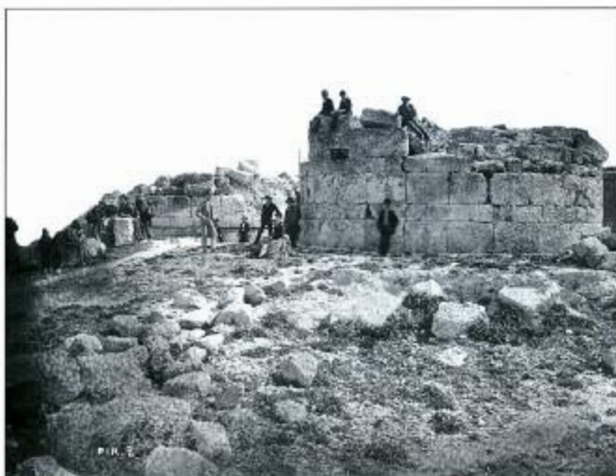
Ερείπια της πύλης του αρχαίου τείχους στην Ηετώνεια (Καστράκι). Φωτογραφία των αρχών του 20ου αιώνα.

Σ ΥΝΤΟΜΑ θα δεσπόζει στο λιμάνι, δίπλα στον Άγιο Διονύση, ένα επιβλητικό μνημείο του αρχαίου Πειραιά. Το εγχείρημα για την αναστήλωση της Ηετώνειας Πύλης , αυτού του στρατηγικού έργου της αρχαιότητας, αναμένεται ότι θα οδηγήσει στη διαμόρφωση μιας άλλης εικόνας της σημερινής πόλης. Οι προσπάθειες του Συλλόγου μας, πάντα σε συνεργασία με τη Β' Εφορία Αρχαιοτήτων, ευοδώθηκαν. Και είναι ενδιαφέρουσα η μέχρι τώρα πορεία των σχετικών με το θέμα αυτό ενεργειών: