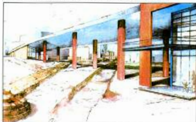
Η μακέτα για την διαμόρφωση του Αρχαιολογικού Πάρκου στην είσοδο της πόλης, που αποτελεί και πρόταση του Συλλόγου μας

• ΕΔΩ και τρία χρόνια ο Σύλλογός μας προσπαθεί μεθοδικά και αθόρυβα να προχωρήσει στην υλοποίηση ενός ακόμη μεγάλου έργου. Και ήδη έχουν προωθηθεί οι σχετικές διαδικασίες, με τη σύνταξη της προμελέτης για τους όρους του αρχιτεκτονικού διαγωνισμού που θα προκηρυχθεί.