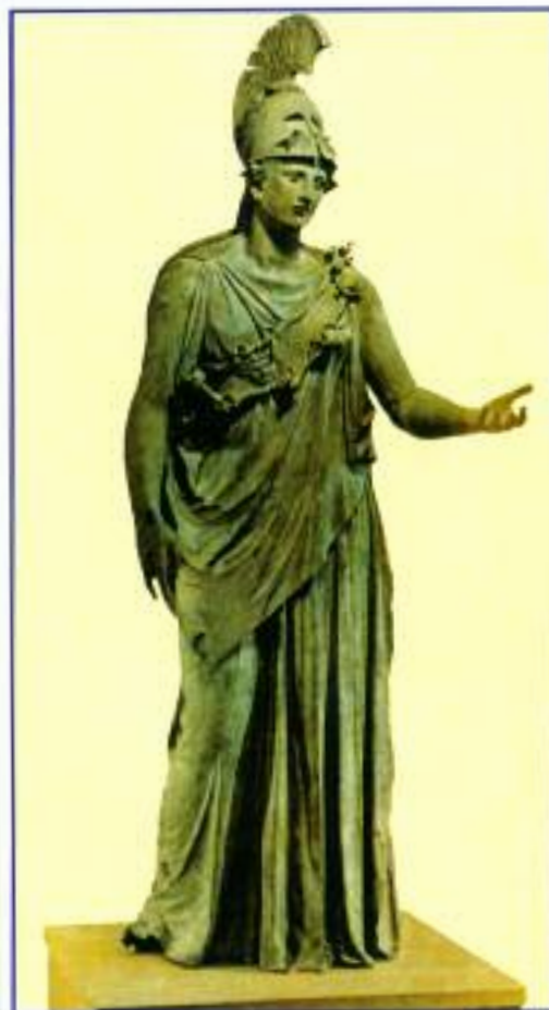
Η Αθηνά του Πειραιώς

- Μία σειρά προθηκών είναι αφιερωμένες στο παιδί (μνιατούρες αγγείων, παιχνίδια και παραστάσεις από τη ζωή του παιδιού, προερχόμενες κυρίως από παιδικές ταφές), στο γυναικωνίτη και στον κόσμο του Αθηναίων με αντικείμενα και