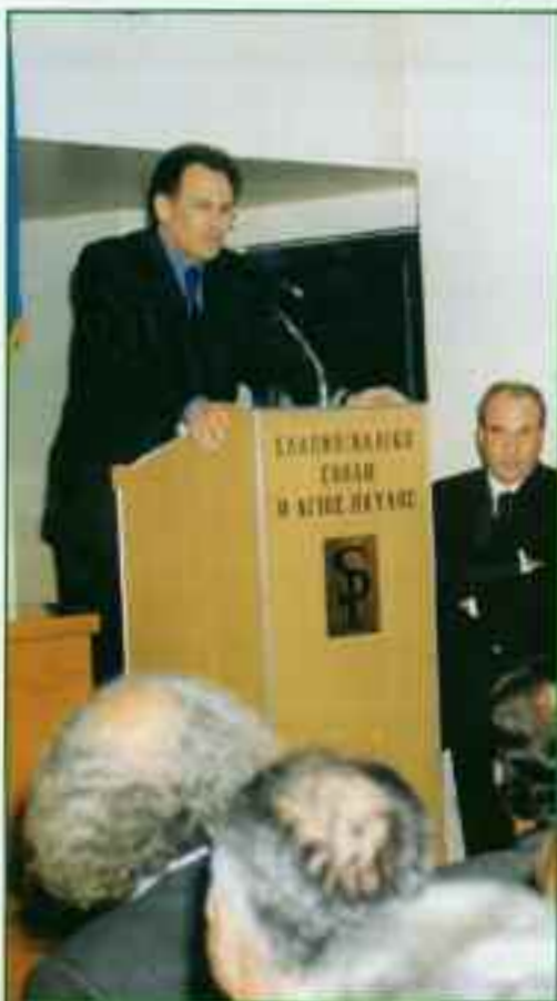
Ο υπουργός ΠΕΧΩΔΕ κ. Κ. Λαλιώτης ενώ εξηγεί τα έργα για τον Πειραιά

Συνειδητοποιήσαμε έτσι ότι η συντήρηση και ανάδειξη τους προσφέρει μια μοναδική δυνατότητα ανάπτυξης και ενισχύσεως - υλικής και ηθικής - του ίδιου του Πειραιά. Κάνουμε γι αυτό πολλά σχέ-